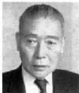
元ガハロー国際親善大使